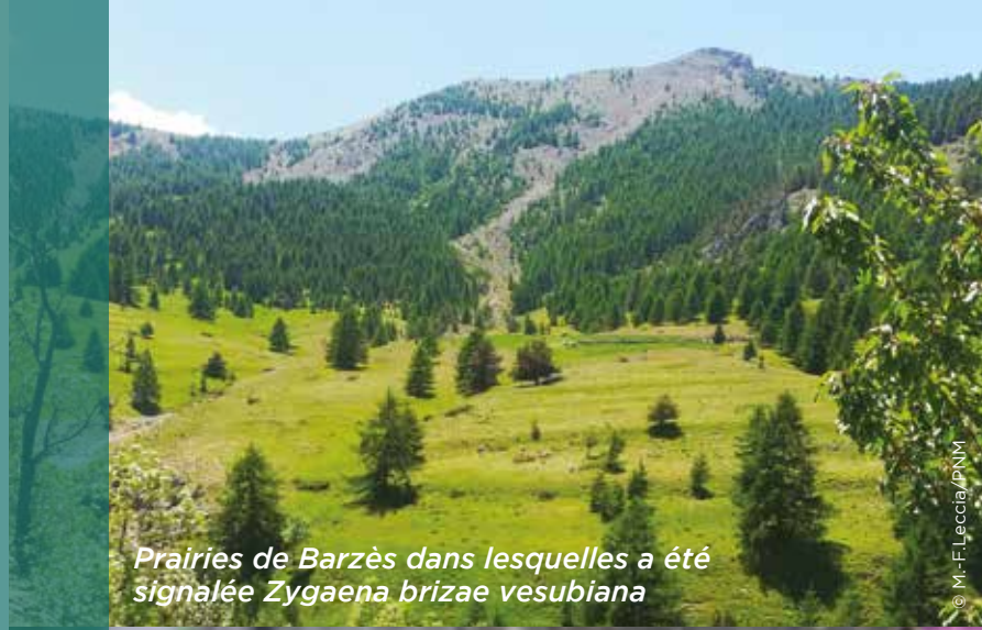
Prairies de Barzès dans lesquelles a été signalée Zygaena brizae vesubiana