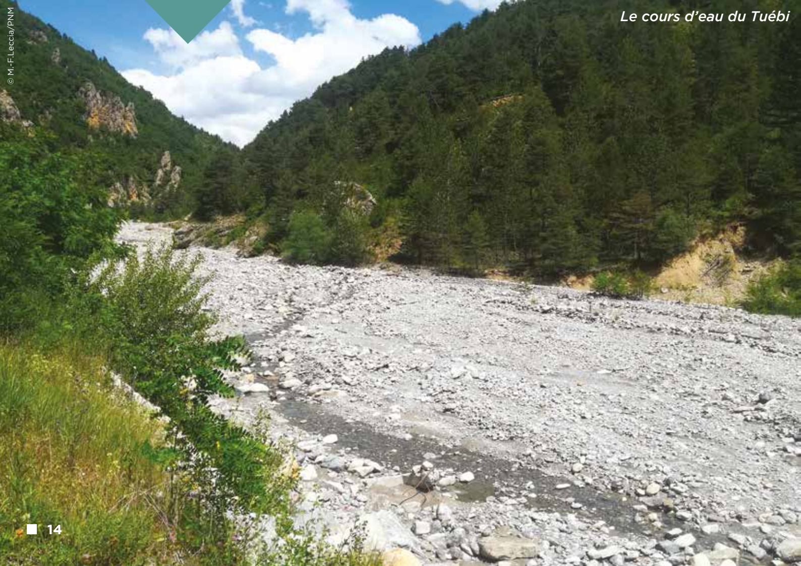
Le cours d'eau du Tuébi