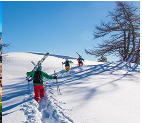
Schéma Régional de Développement Touristique 2017-2022